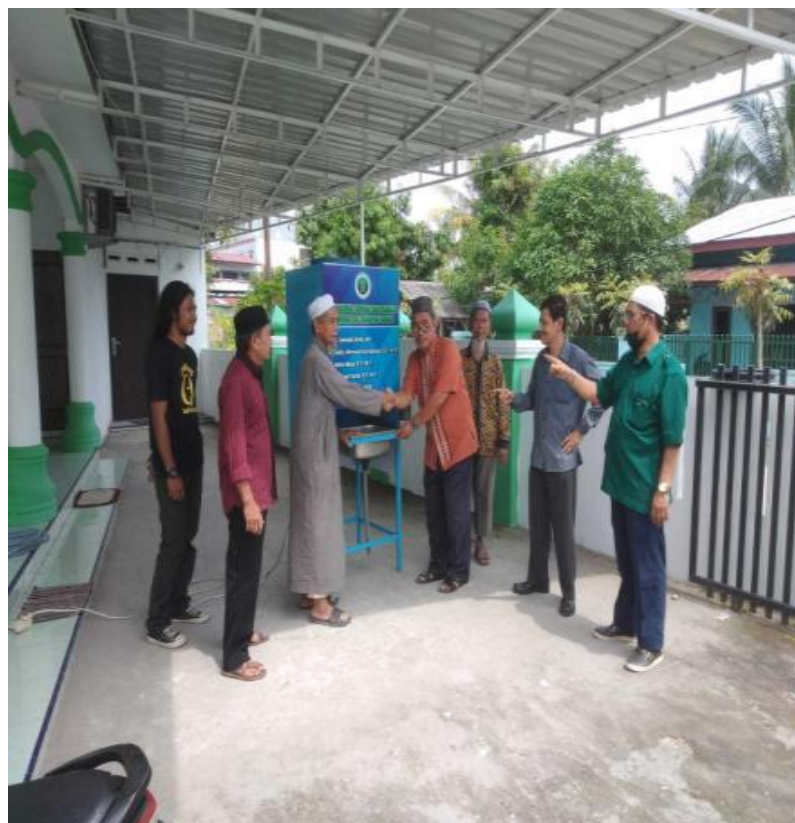
Gambar 1. Kegiatan Pengabdian PKM

Foto kegiatan melakukan pengabdian pada masyarakat sosialisasi penggunaan tempat cuci tangan otomatis di mushola baitur rahim.