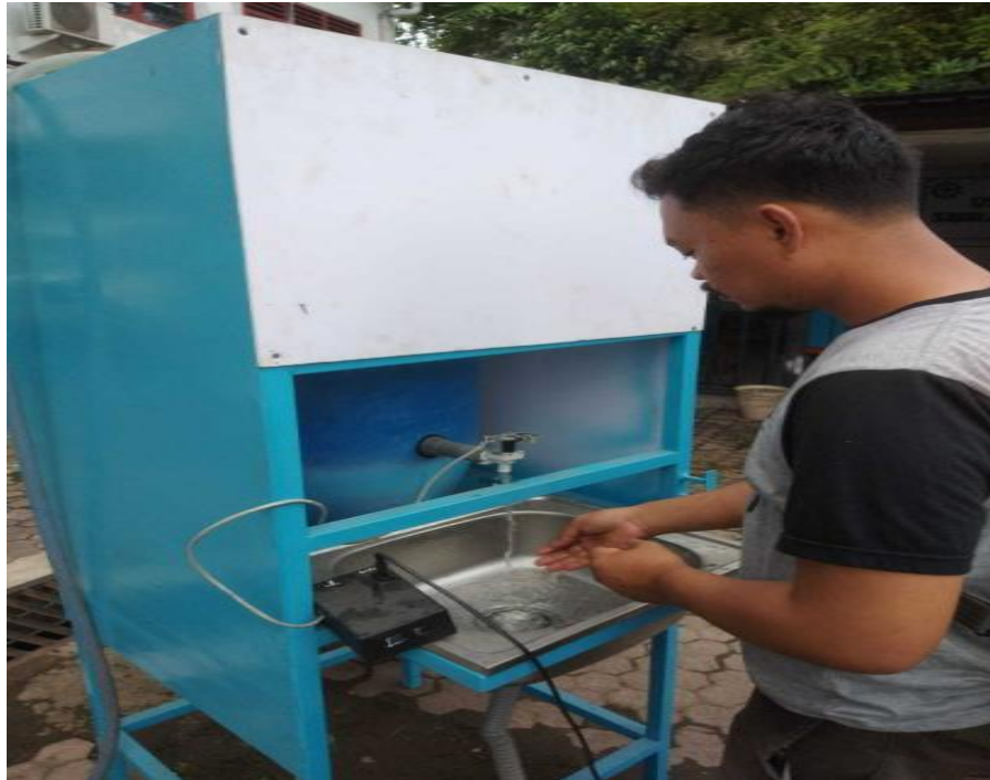
Gambar 1 Tempat Pencuci Tangan Otomatis